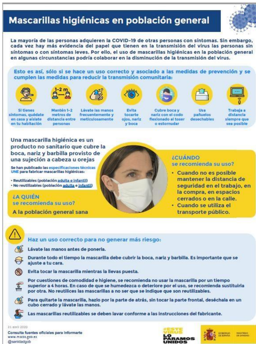
Mascarillas higiénicas en población general (Ministerio de Sanidad, 2020)

Nota: las mascarillas quirúrgicas y las mascarillas higiénicas no son consideradas EPI.